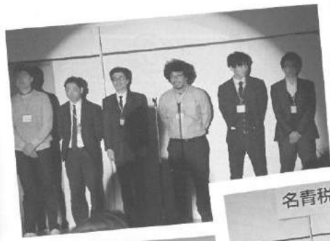
名青税 新入会員歓迎会