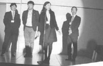
名青税 新入会員歓迎会