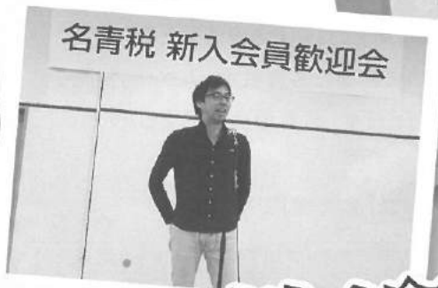
名青税 新入会員歓迎会